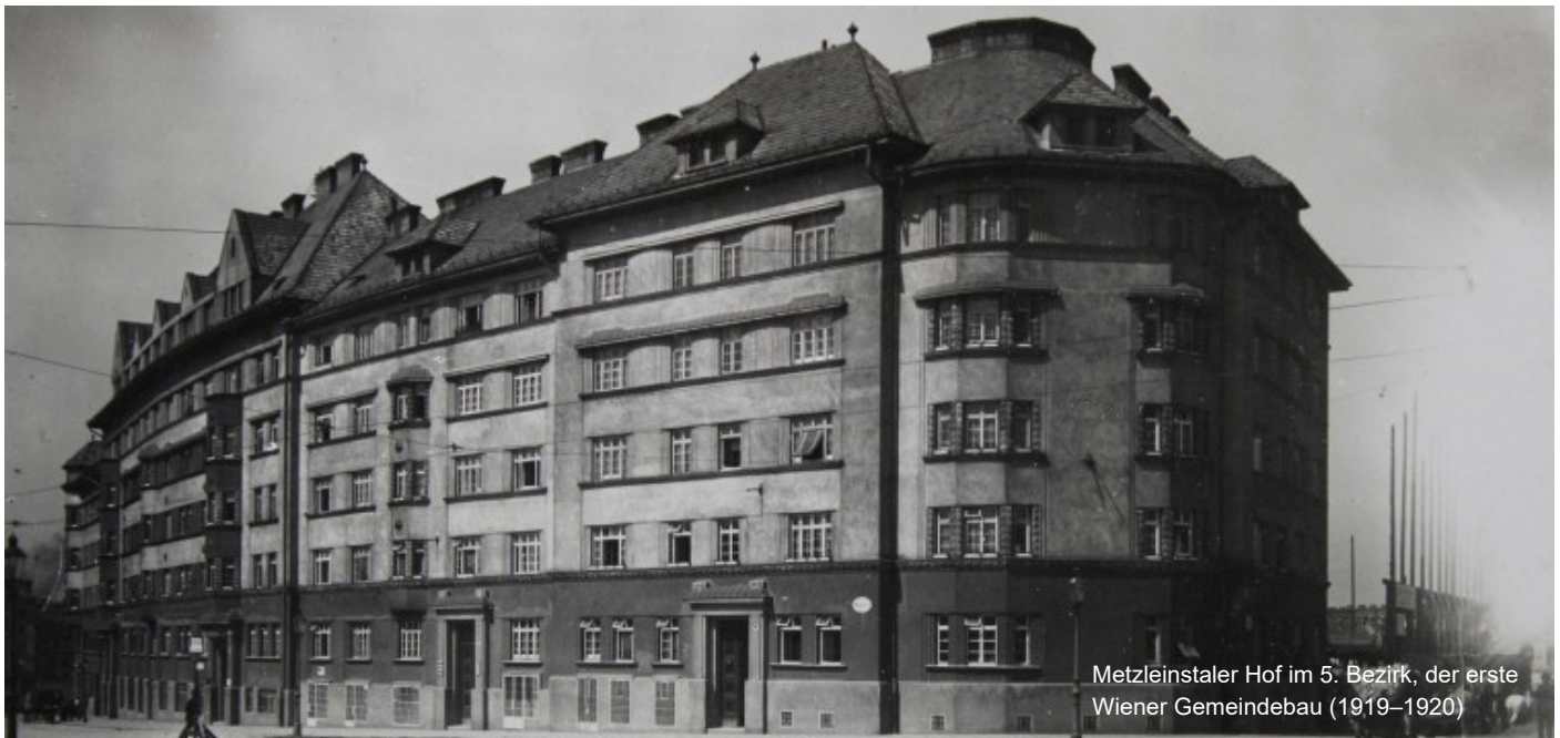
Metzleinstaler Hof im 5. Bezirk, der erste Wiener Gemeindebau (1919–1920)